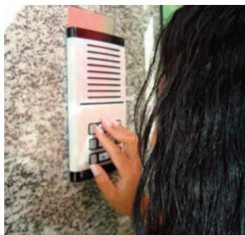
Equipamento deve estar em perfeitas condições de uso para a segurança dos moradores

TIPOS - Atualmente, são três os tipos de sistemas de interfone para condomínios disponíveis no mercado: sistema analógico, sistema digital (qualidade superior, porém mais caro) e sistema por PABX (que permite realizar e receber cha-