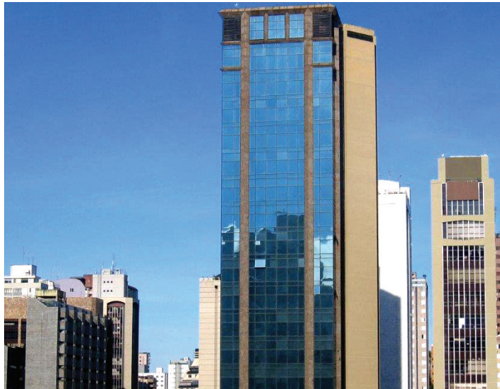
Conservação da edificação será preservada com a inspeção predial

Todos os documentos administrativos, técnicos, de manutenção e operação da edificação e outros, deverão ser verificados e analisados pelos inspetores, quando disponíveis. A norma de inspeção predial servirá de ferramenta para a avaliação de todos os sistemas, subsistemas, elementos e componentes construtivos de uma edificação.