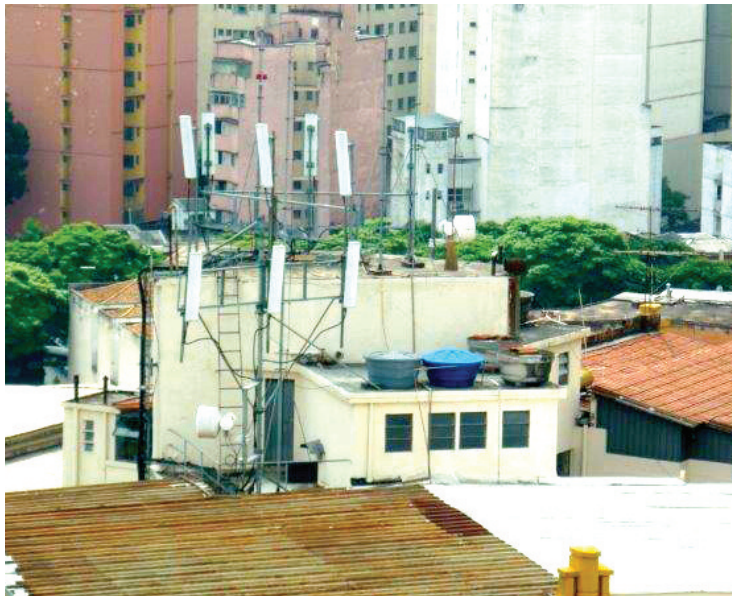
Antenas podem gerar recursos para o condomínios